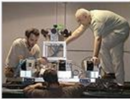
Google-Ingenieure bei der Montage von Kameras auf dem Dach des Street View-Vans