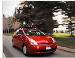
Street View-Fahrzeug im Einsatz