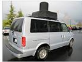
Ein Street View-Van der ersten Generation